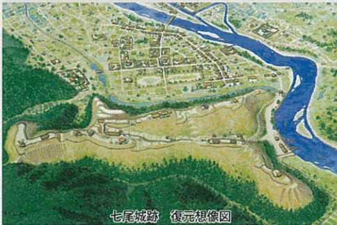
七尾城跡 復元想像図