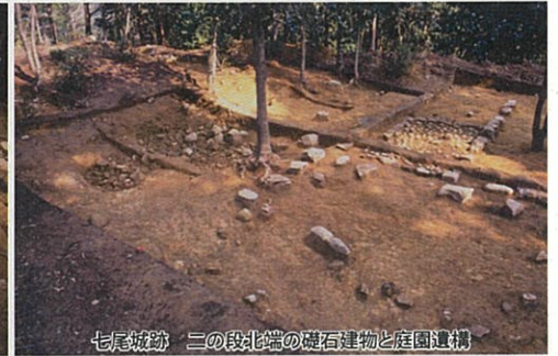
七尾城跡 二の段北端の礎石建物と庭園遺構