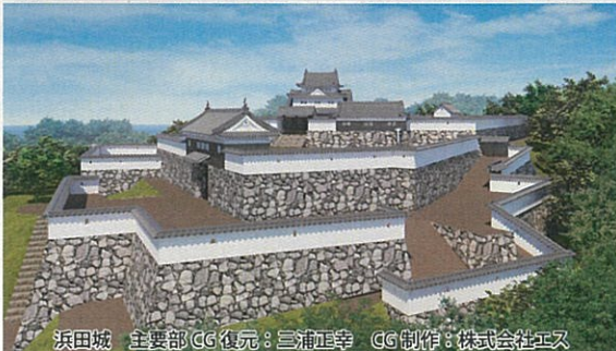
浜田城 主要部CG復元：三浦正幸 CG制作：株式会社エス