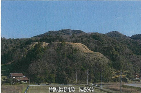
普源田砦跡 西から