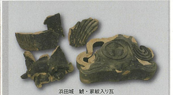
浜田城 鯨・家紋入り瓦