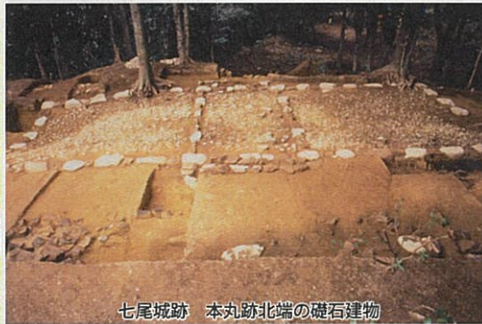
七尾城跡 本丸跡北端の礎石建物