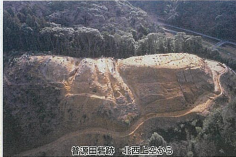
普源田砦跡 北西上空から